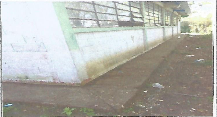
La falta de circulación permite la entrada de animales de los vecinos.

Observación: Si es necesario se pueden agregar hojas adicionales y actualizar el número de hojas.