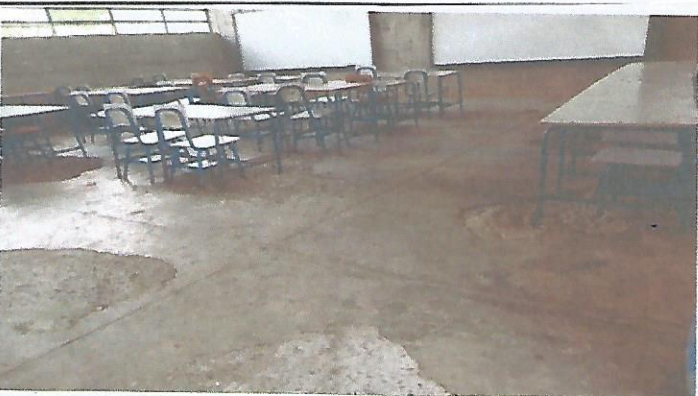
Se necesita remodelar la parte dañada de un escritorio.